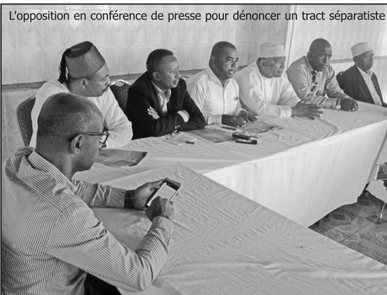
L'opposition en conférence de presse pour dénoncer un tract séparatiste

Dans une conférence de presse tenue hier, l'opposition est montée au créneau pour dénoncer l'inaction de l'état après qu'un tract séparatiste ait été publié à Moroni.