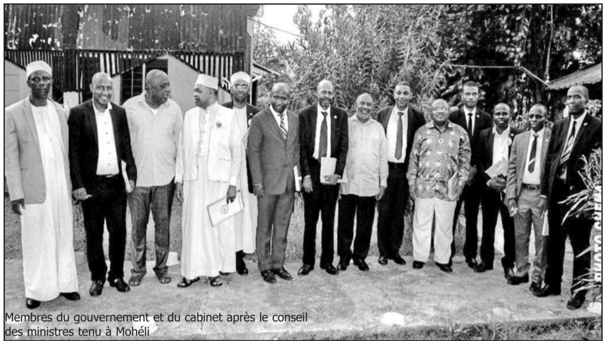
Membres du gouvernement et du cabinet après le conseil des ministres tenu à Mohéli

Le ministre de l'intérieur a présenté les dispositions qui seront mises en place pour la sécurisation et la réussite des assises afin que l'intégrité physique de chaque participant ne soit pas remise en cause."