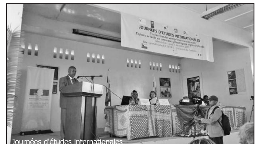
Journées d'études internationales