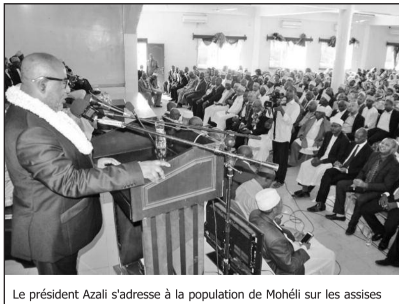
Le président Azali s'adresse à la population de Mohéli sur les assises

C'est pourquoi la présence de toutes les composantes du pays, notamment les partis politiques, est