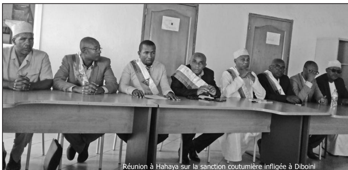
Réunion à Hahaya sur la sanction coutumière infligée à Diboini

A en croire le maire victime, il n'a jamais été convoqué ni à la gendarmerie ni devant un juge depuis cette affaire. Il affirme devant les médias que les présumés auteurs, originaires de Diboini et aux mains de la gendarmerie, « ont avoué les faits ». Par la même occasion, il fera savoir que la cible initiale était lui-même « mais les auteurs ont fini par s'en prendre à mon véhicule ». Pour lui, si les notables s'immiscent dans cette affaire jusqu'à demander répa-